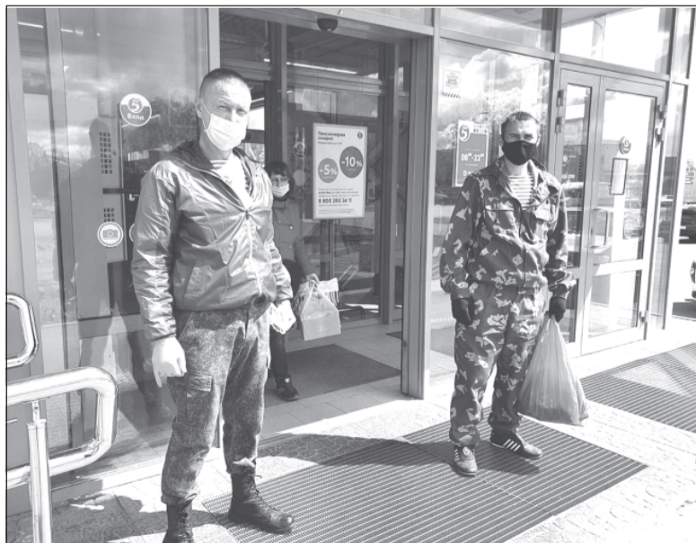
Нет масок и перчаток? Приволжские «Волонтеры Победы» раздавали их бесплатно в рамках акции