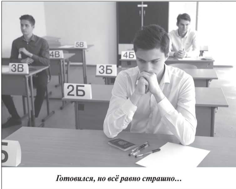
Готовился, но всё равно страшно...