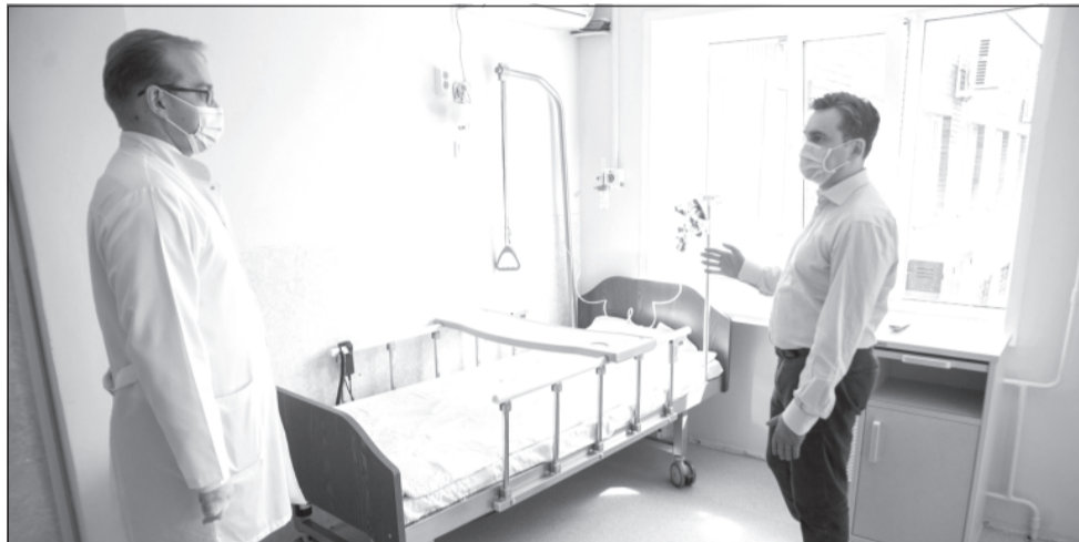
На базе медицинского центра «Решма» развернуто 139 инфекционных коек.