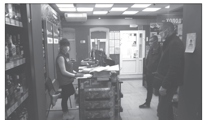
Замечания комиссии обязательны для исполнения

Выявлены нарушения: магазин «Пятерочка» (ул. Станционный проезд) - допущены к работе несколько сотрудников без чек-листа, отсутствует приказ о назначении ответственного