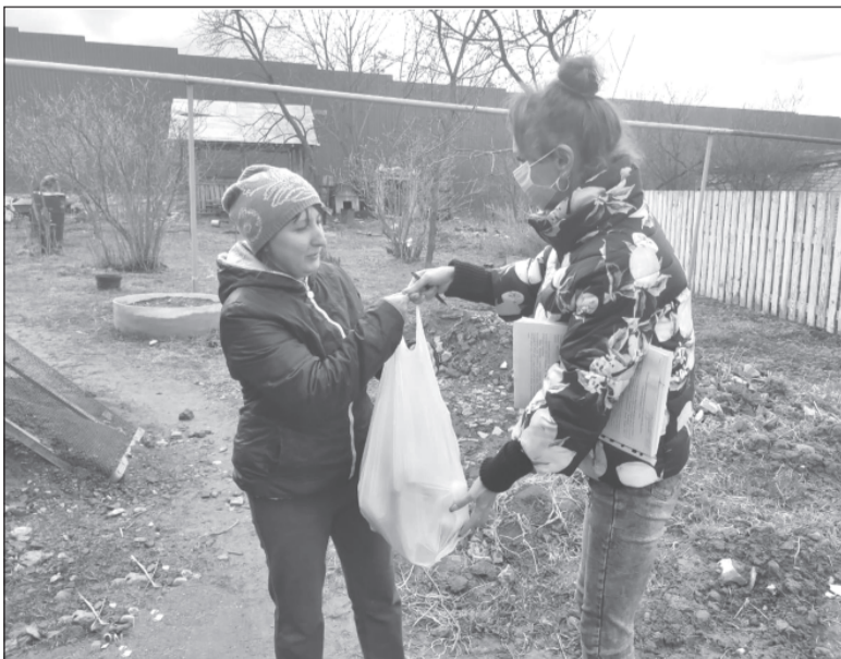
Пандемия - настоящее испытание. И тут на помощь приходят неравнодушные люди