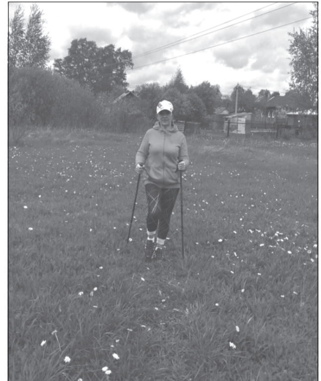
Скандинавская ходьба для членов клуба ЦСО – это способ укрепления здоровья и средство общения