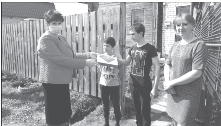
О таком подарке ребята и не мечтали!

В условиях особого режима необходимость перехода на дистанционное обучение выявила ряд проблем. Они коснулись в первую очередь многодетных семей. Обращения с просьбой помочь в организации качественного получения знаний поступили от жителей района в местную общественную приемную.