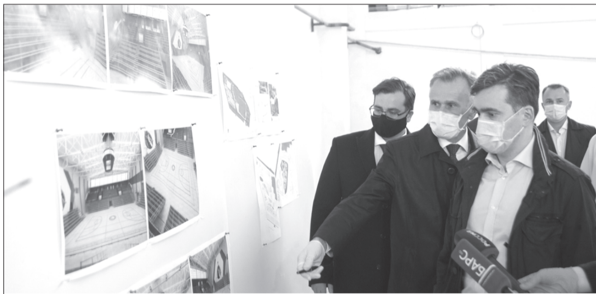
С. Воскресенский: «Объект должен органично вписаться в архитектурный облик Иванова».

Дворец водных видов спорта расположится в центре города Иванова, на набережной реки Уводь. К проектированию объекта приступят уже в текущем году. Об этом сообщил губернатор Ивановской области Станислав Воскресенский в ходе инспекционной поездки на строительство другого спортивного объекта - Дворца игровых видов спорта.